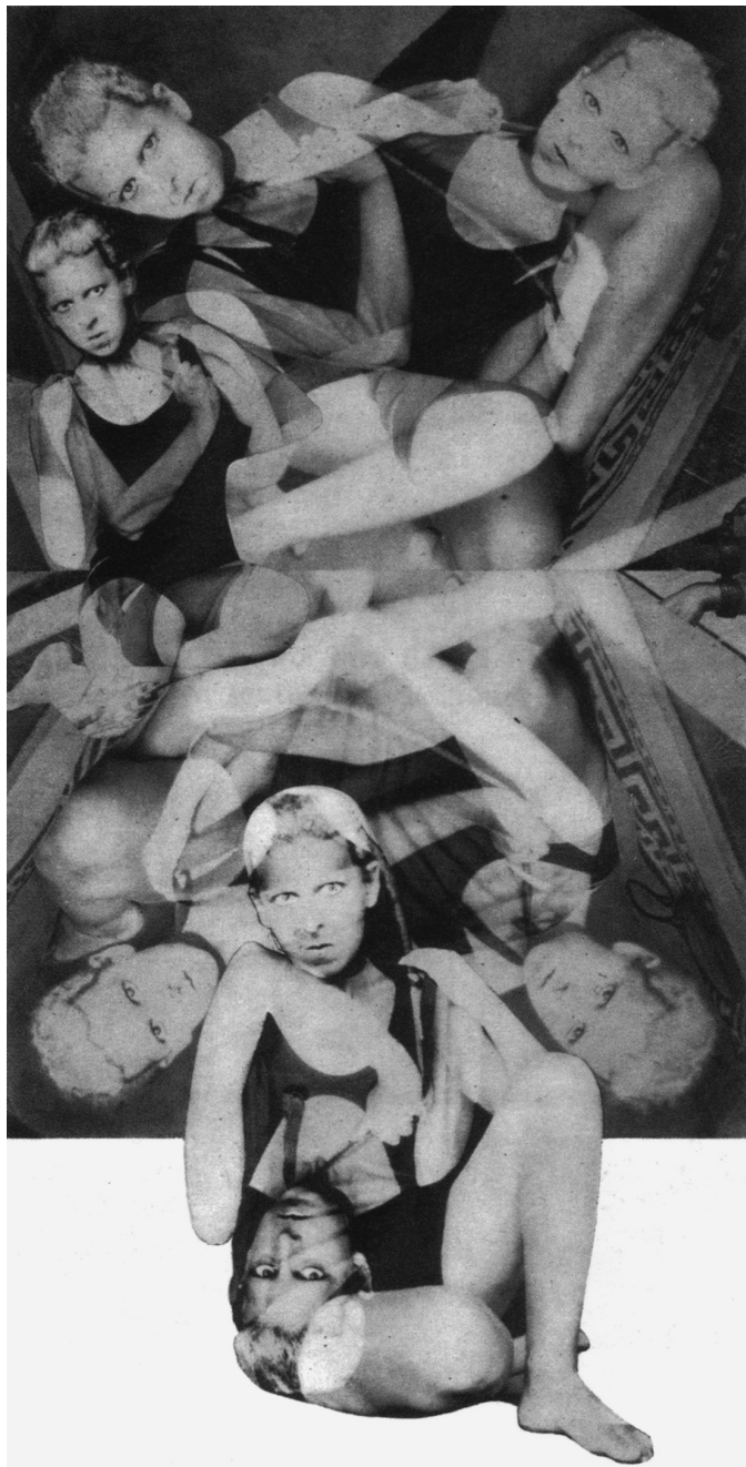
2 Claude Cahun/ Marcel Moore: Photomontage, Tafel IX aus den Aveux non avenues. 1929–30, Éditions du Carrefour, Paris