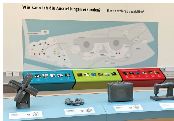
// Abbildung 01 Thematische Museumsrundgänge im Deutschen Technikmuseum Berlin: Technik und Mensch (blau), Technik und Natur (grün), Technik und Krieg (rot).

— Problematisch war für mich, dass es an einer kritischen