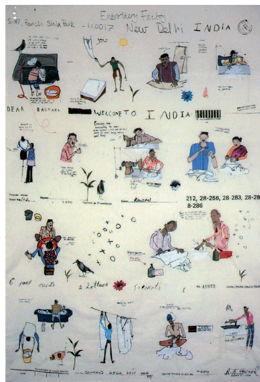
// Abbildung 03 Rachael Howard, Indian Embroidery Factory, 1999, Wandbild, 220 x 130 cm, Ausstellung Textiltechnik im Deutschen Technikmuseum Berlin.