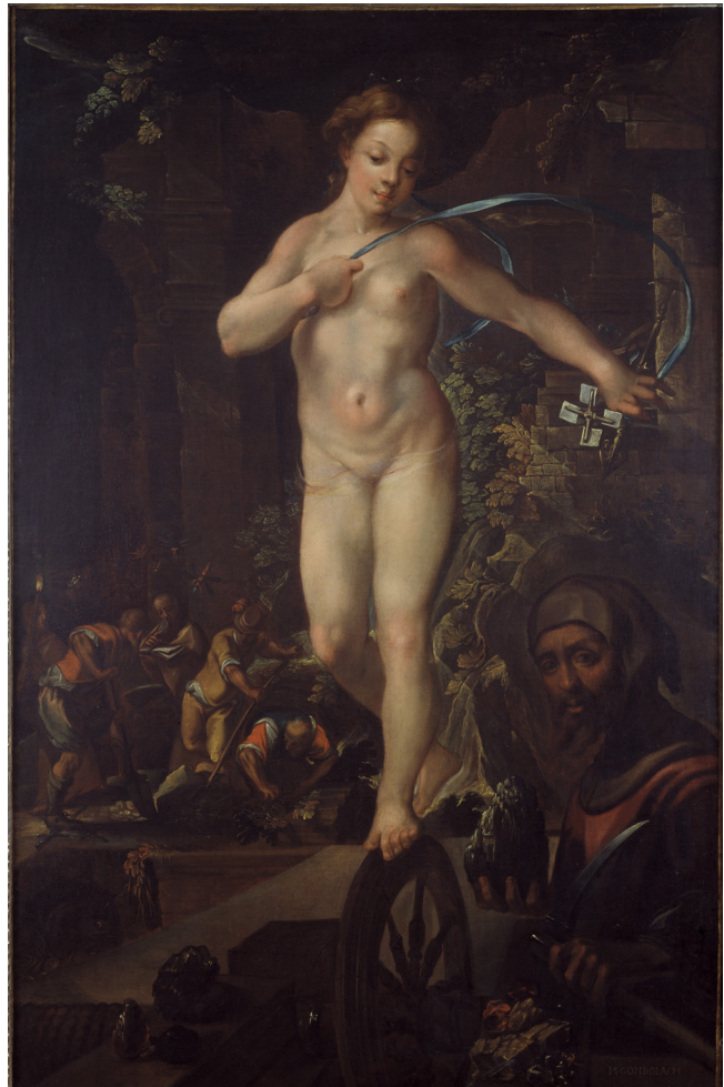
// Abbildung 2 Matthäus Gundelach, Allegorie des Bergbaus (ca. 1620)

„Ein bawender Gewercke beym Bergwerck muß eine starcke Hoffnung auf reiche Außbeute haben / wiewol es geschiehet / daß man bey seiner guten starcken Hoffnung offft betrogen wird