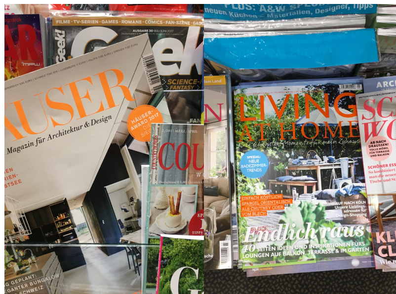
// Abbildung 1 Wohnzeitschriften im Buchhandel 2017.