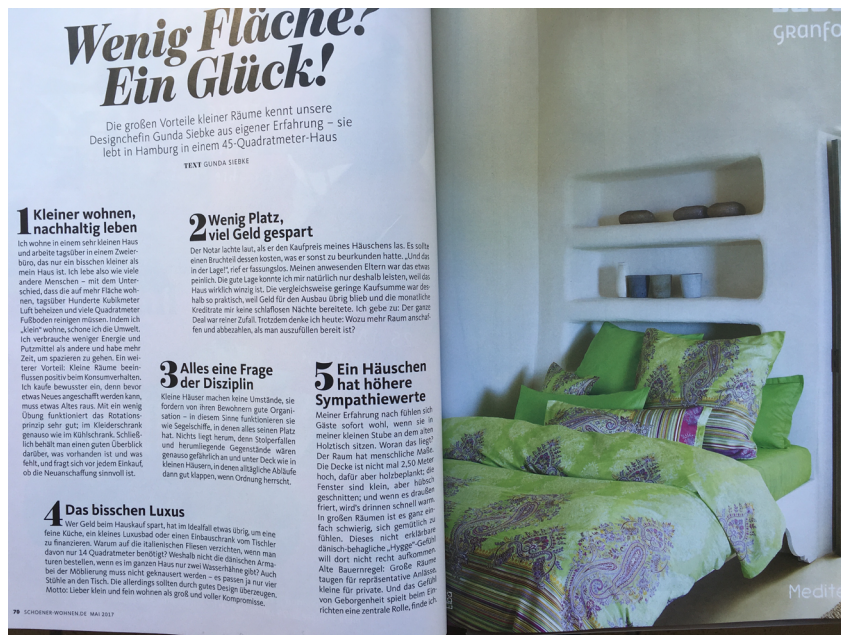
// Abbildung 2 Fünfpunkteprogramm zur Minimalwohnung. In: Schöner Wohnen, Mai 2017, S. 70–71

In den Analysen gilt es den gesellschaftlichen Ort der Wohnzeitschrift, ihren Ort im Feld des Wohnens und das Wohnen der aufgeblätterten Seiten zu präzisieren und damit ihre Position in Wohnwissen, Schau_Platz und Pädagogisierung zu lokalisieren. Die Zeitschrift ist ein spezifischer Display, ein angeordneter und serialisierter Verbund von Bildern und Texten, Bilder- und Textsorten. Wenn der Display der Wohnzeitschrift zugleich als soziales Geflecht verstanden wird, geht es also nicht nur darum, was und wie die Zeitschrift tut, sondern es bleibt auch die Frage: In welcher gesellschaftspolitischen Konstellation – man kann auch sagen, in welchem gesellschaftlichen Display – steht die Zeitschrift selbst? Ein Pfad führt an die Schnittstelle von Wohnen und Warenproduktion. Und diese Lokalisierung macht die Wohnzeitschrift anscheinend auch ‚verdächtig‘. Denn wie Wohntheoretiker_innen und Wohnerzieher_innen formulieren und formulierten, verführten die Wohnzeitschriften die Wohnsuchenden, blendeten ihren Blick und Verstand. Solche Äußerungen sind seit dem 19. Jahrhundert