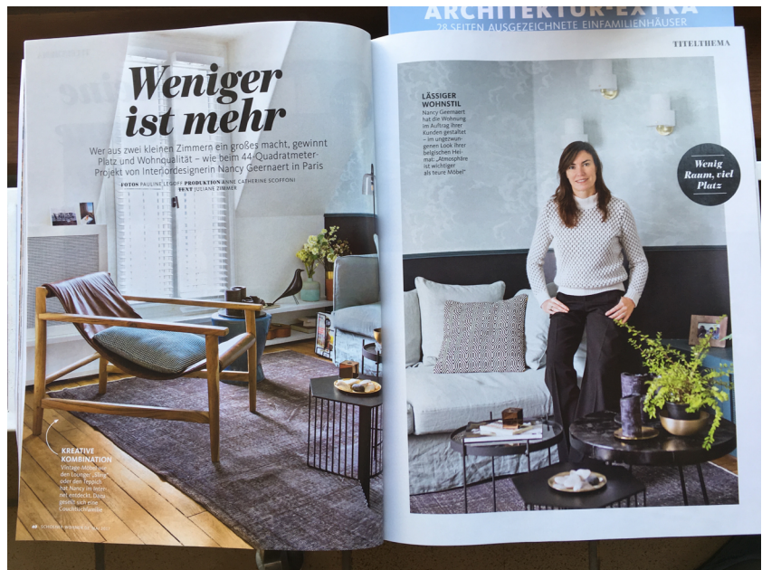
// Abbildung 3 Erklärung einer Innenraumgestalterin zu den Vorzügen einer Minimalwohnung. In: Schöner Wohnen, Mai 2017, S. 40–41