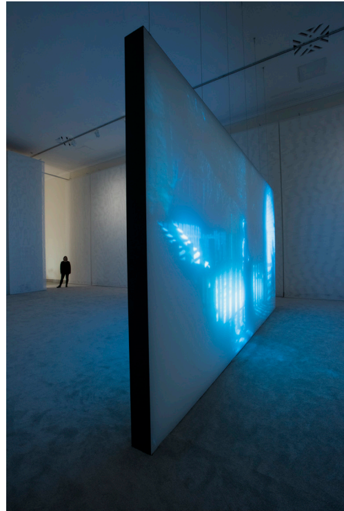
// Abbildung 11 Rachel Rose, Wil-o-Wisp , 2018, Installationsansicht.

herstellen, das alle Dinge (wieder) verbindet. Mit „Gleichgewicht“ aber scheint hier im neomaterialistischen Sinne insbesondere flache Hierarchien und eine verteilte Handlungsmacht aller menschlichen und nichtmenschlichen, lebenden und nichtlebenden Akteur*innen eines Gefüges gemeint zu sein. Wil-o-Wisp ruft diese gerade in der Szene der Transfermagie oder dem Motiv einer animierenden Landschaft auf und lässt sie auf der filmischen Material- ebenso wie auf der Präsentationsebene durch die Betonung der Dynamik und metamorphischen Qualität des Filmkörpers widerhallen. Die Macht der Magie als besondere Form des Bewusstseins und als „Handwerk der Gefüge“ die Realität zu transformieren (Stengers 2012: 118), findet in Wil-o-Wisp dagegen im Übergreifen des Moiré-Effekts der filmischen Erzählung auf die Wände des Ausstellungsraums eine Entsprechung. Sie sind mit einem weißen Stoff bespannt, der denselben Moiré-Effekt wie auf der filmischen Bildebene erzeugt und damit nicht nur die Bildmotive, sondern auch die reale Umgebungen der Betrachter*innen einer magisch anmutenden Metamorphose unterzieht [Abb. 11].