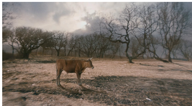
// Abbildung 1 & 2

Rachel Rose, Wil-o-Wisp , 2018, Videostills.