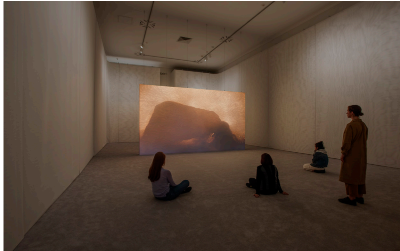
Abbildung 10 Rachel Rose, Wil-o-Wisp, 2018, Installationsansicht.