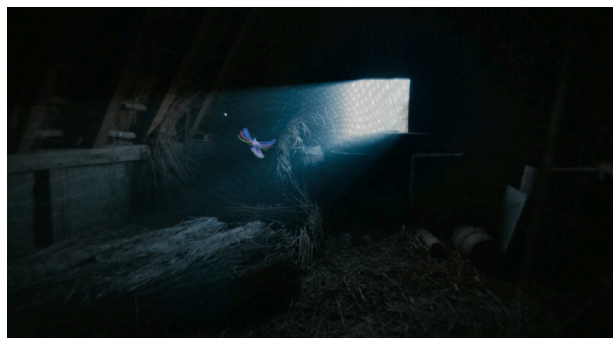
// Abbildung 9 Rachel Rose, Wil-o-Wisp , 2018, Videostills.