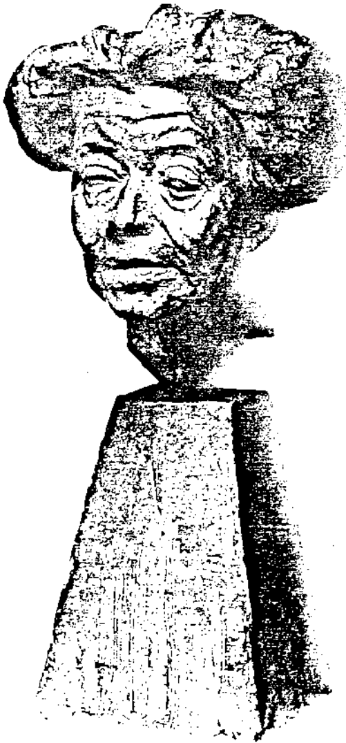
Clara Rilke-Westhoff: Porträt der Schriftstellerin Ricarda Huch, 1912, Gips, H. 58, 3cm, Rilke-Archiv, Gernsbach

- Clara Rilke-Westhoff. Die Bildhauerin 1878 - 1954. Gerhard Marckshaus Bremen, Nov. 1986 - Jan. 1987 Georg Kolbe Museum Berlin, März - April 1987 Clemens-Sels-Museum, Neuss.