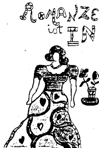
Niki de Saint Phalle, Aus dem 52-seitigen Aidsbuch, 1986/87