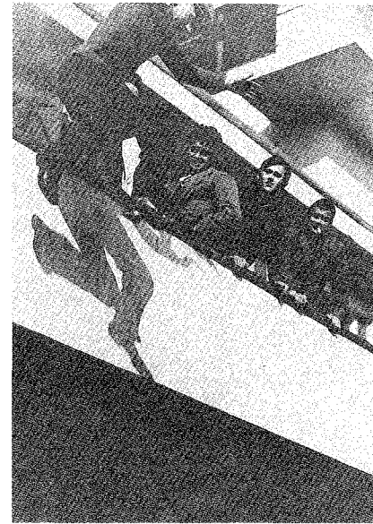
2 Anonym: Sprung von der Terrasse der Bauhauskantine, 1920 (aus: Fotografie am Bauhaus, Nr. 224)

Die Fotografie antizipiert auf diese Weise die Auflösung der Materie, die mit dem Neuen Bauen erreicht werden sollte. 15 Mit der Entmaterialisierung gerät auch das Verhältnis zwischen Subjekt und Objekt in Fluß. Wie Architektur und Raum durch die ex-