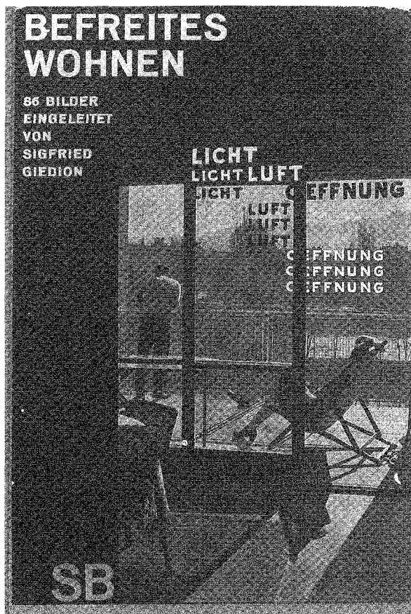
1 Sigfried Giedion: Befreites Wohnen. Titelbild, 1929

Die Bauhüsler gingen – nach Marianne Brandt – in der aktiven Aneignung architektonischer Außenräume einen Schritt weiter als Giedions Schrift impliziert; Balkone und Terrassen sind oftmals nicht mehr nur (wohnungsbezogener) Aufenthaltsraum, sondern ein filigranes Gerüst, das zwischen Mensch und freiem Raum steht und seiner ungebundenen/ungebeschränkten Bewegung dienstbar ist.