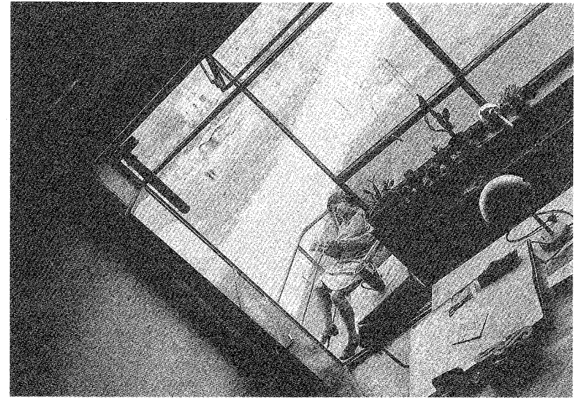
6 Werner Zimmermann: Marianne Brandt auf dem Balkon ihres Wohnateliers, 1928 (aus: Fotografie am Bauhaus , Nr. 190)

Der Vergleich dieses Fotos von Lou Scheper mit der zuvor betrachteten Aufnahme Moholy-Nagys gibt zudem einen klaren Hinweis darauf, daß für die Frauen am Bauhaus eine Transformation vom passiven Status der Muse und des erotischen Objektes zum aktiven der Künstlerin auch durch die Übernahme der männlichen Rolle nicht ohne weiteres bewerkstelligt werden konnte. Lou Scheper kam 1920 als Studentin ans Weimarer Bauhaus und arbeitete gemeinsam mit ihrem späteren Mann Hinnerk an den