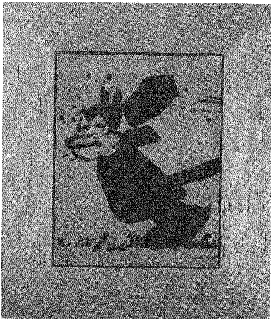
Sherrie Levine, Untitled (Krazy), 1988, Kasein auf Holz

Bekanntlich ist es gerade die homogene Einheit der Repräsentation – die Bejahung der Referenz –, welche in klassischen Karikaturen und Bilderfabeln die Verwendung anthropomorpher Tierfiguren überhaupt ermöglicht . Ob karikierende