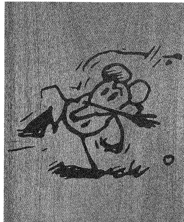
Sherrie Levine, Untitled (Ignatz), 1988, Kasein auf Holz

Stilisierung menschlicher Eigenschaften, ob Transformation zwischentierischer Hierarchien (Katzen verfolgen Mäuse, Hunde verfolgen Katzen) ins Menschenreich: Immer wird das Verhältnis zwischen 'darstellenden' Tieren und 'dargestellten' Menschen aus der Perspektive einer 'Moral' reguliert, eines Abschlusses im Signifikat, in welchem das Geschehen der Fabel – letztlich – aufgehoben ist. Diese klassische Bezugnahme auf menschliche Vorbilder wird bei Krazy und Ignatz, im erläuterten Sinne, verneint : nicht negiert, sondern bei bleibender Kenntlichkeit suspendiert. Indem die natürliche Hierarchie zwischen den Tieren durch eine – gegenläufige – sexuelle Hierarchie ersetzt wird, gerät deren Differenz zum Gegenstand eines Witzes. Nicht die Katze jagt die Maus, eine 'sadistische' Maus jagt eine 'masochistische' Katze.