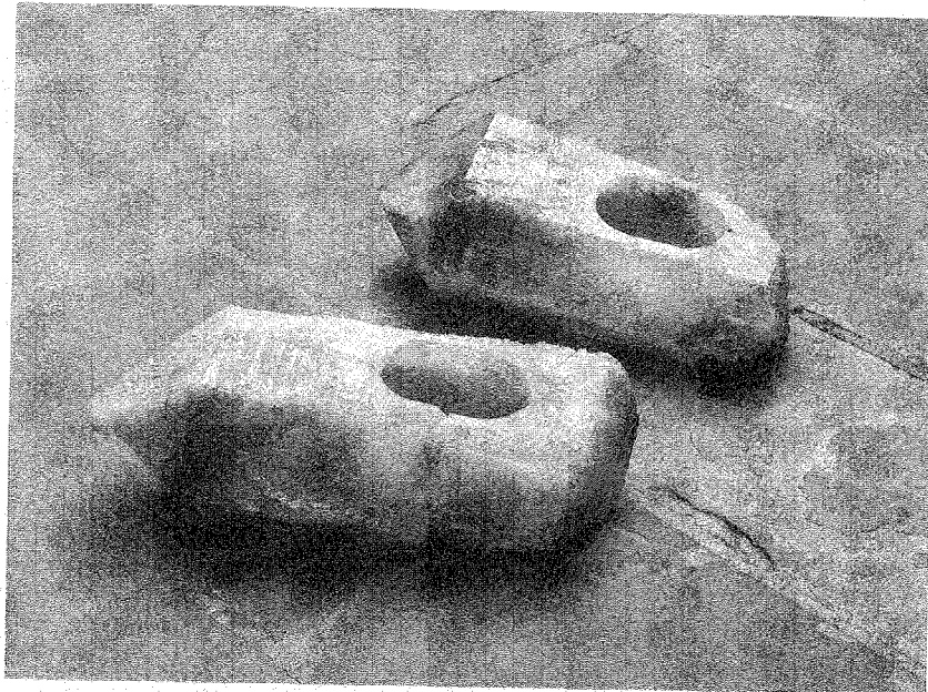
Marina Abramovic: Shoes vor Departure, 1992 (Amethyst)

Dank der Unterstützung der Hessischen Kulturstiftung bleiben diese Schuhe im Landesmuseum Darmstadt. An Künstler und Künstlerinnen, die weg wollen, vergibt sie Reisestipendien und stellt ihnen ihre Ateliers in London, Paris oder New York zur Verfügung.