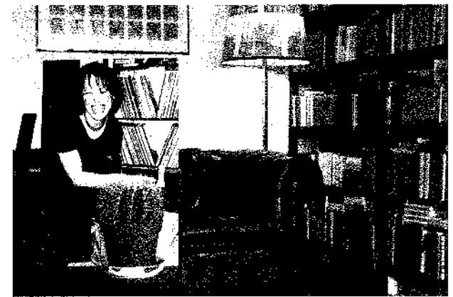
Sascha Reichstein, Situationen im Bild – Positionen im Raum, 2003 C-Prints color, 38 x 56 cm, gerahmt, aus einer Serie von 20 Fotografien